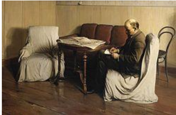
Картина И.Бродского «Ленин в Смольном» (1930 г.)

«Около 9 утра комиссар Уралов был в штабе ВРК (военно-революционный комитет) в здании Смольного, ожидая инструкций. Моё воображение